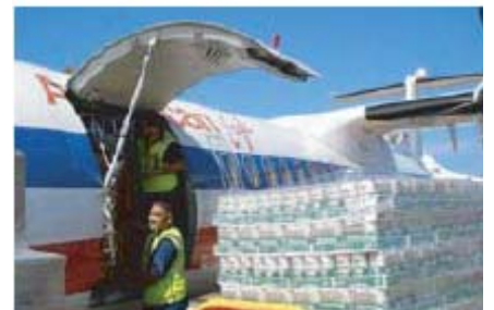
美国航空运输的救灾物资超过400,000磅