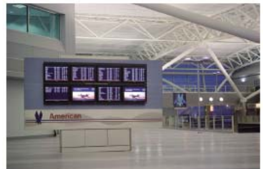
美国航空肯尼迪国际机场航站楼